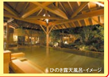
ひのき露天風呂イメージ