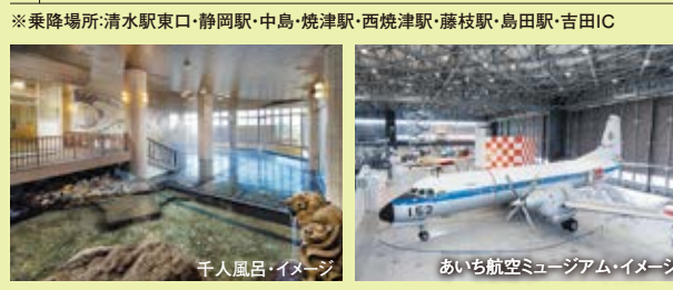
千人風呂イメージ

※乗降場所:清水駅東口・静岡駅・中島・焼津駅・西焼津駅・藤枝駅・島田駅・吉田IC