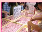
桔梗信玄餅 詰め放題