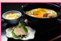
長寿村権六 ほうとう膳