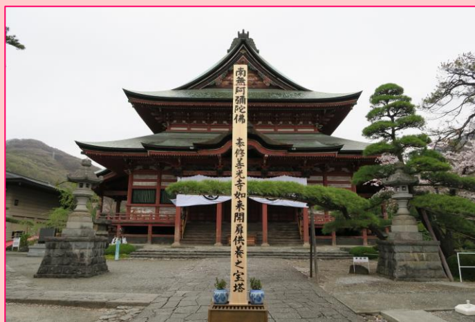
甲斐善光寺 御開帳

・食事(昼食1回)・交通費(貸切バス)・観光費 ・最少催行人員25名 ・添乗員なし ・バスガイド 同行 ・バス会社 アンビバス 他