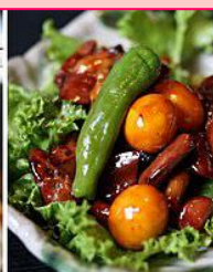
奥藤本店 昼食イメージ