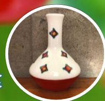
かわいいー輪挿し