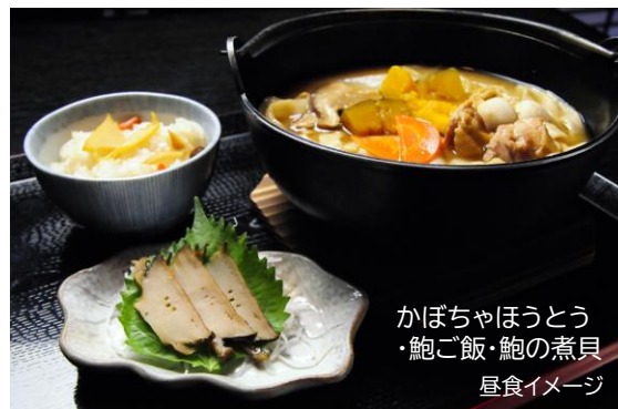
かぼちゃほうとう ・鮑ご飯・鮑の煮貝 昼食イメージ