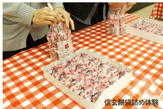
信玄餅袋詰め体験

信玄餅袋詰め体験は、予め決められた袋をいただき、ご自身で詰められる「信玄餅の個数」を当日、申告していただき、袋詰めを行います。袋に入らなかった残った信玄餅に関しましては、お店に戻すことができず、入らなかった分は買取りとなりますためご注意ください。