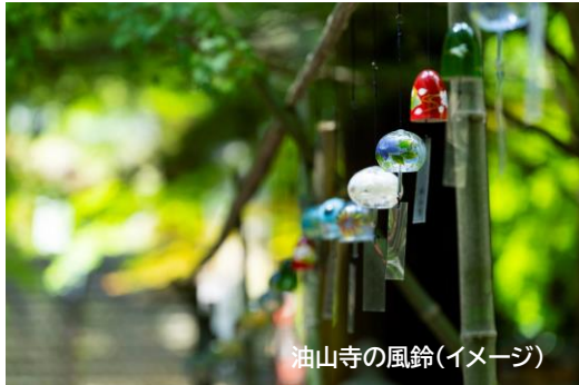
油山寺の風鈴(イメージ)