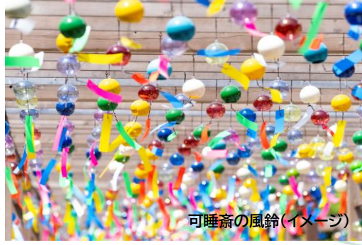
可睡斎の風鈴(イメージ)