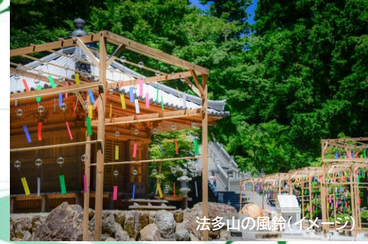
法多山の風鈴(イメージ)